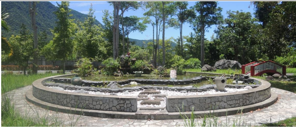
法務部矯正署泰源技能訓練所政風室編撰