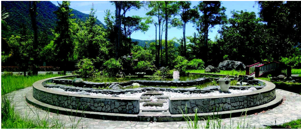
法務部矯正署泰源技能訓練所政風室編撰