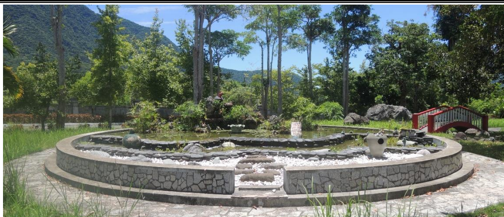
法務部矯正署泰源技能訓練所政風室編撰