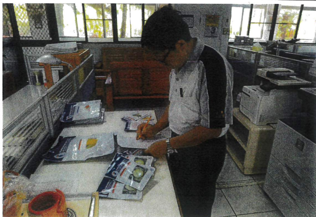
農作組作業導師清點種子數量