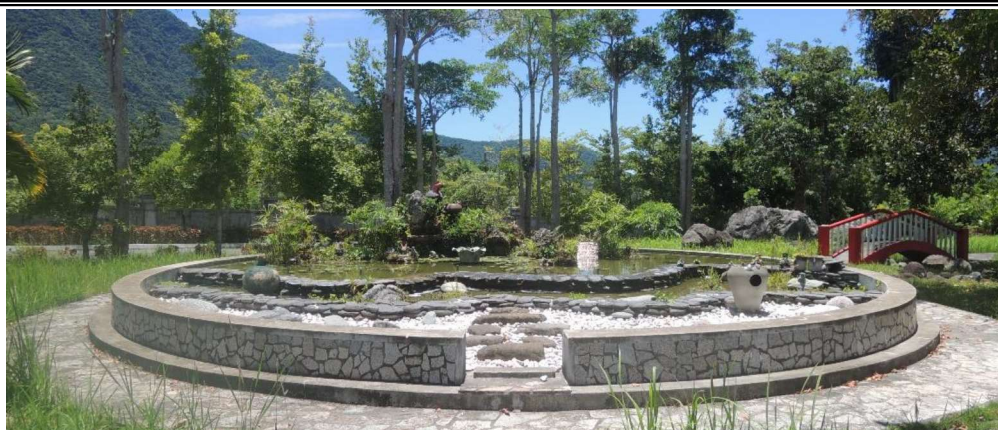
法務部矯正署泰源技能訓練所政風室編撰