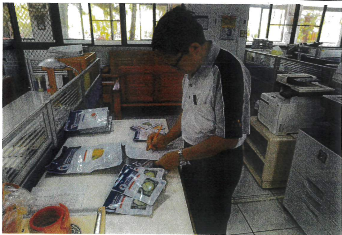
農作組作業導師清點種子數量