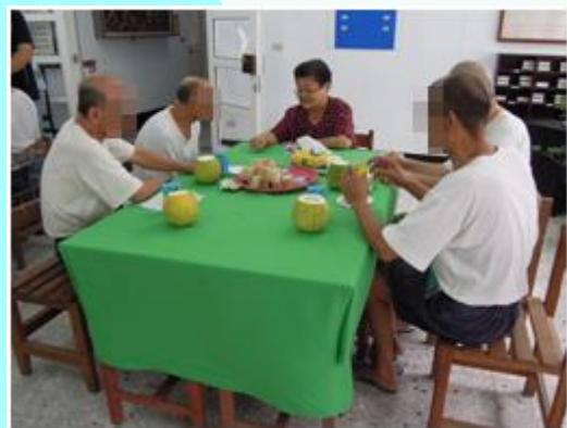
104.9.18 更生輔導志工辦理收容人出所前就業更生輔導情形