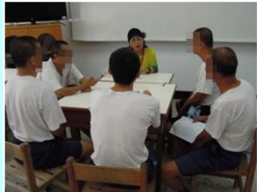
104.9.9 更生輔導志工辦理收容人出所前就業更生輔導情形